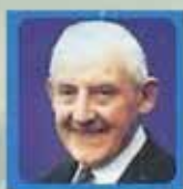
Serv ta' Alla Frank Duff